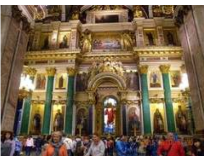
성이삭 성당 : 내부관람 (러시아)