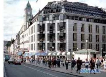
카를 요한스 거리(노르웨이)