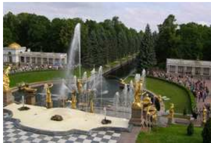
표트르 대제의 여름궁전(러시아)